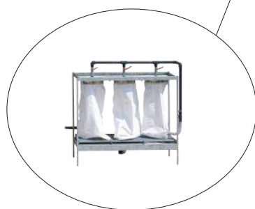
Available sludge storage